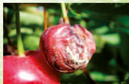
Monilióza na třešni