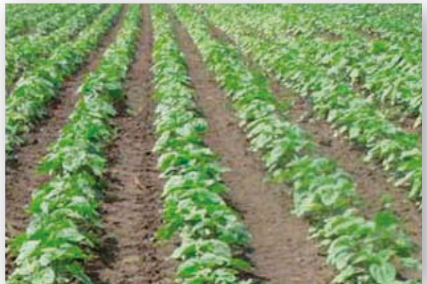
Po preemergentním ošetření přípravkem Wing-P se slunečnice zdravě vyvíjí.