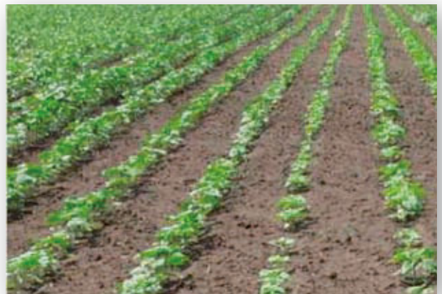
Neselektivní preemergentní ošetření slunečnice proti plevelům způsobuje značnou retardaci porostu.

Na uvedených obrázcích je na první pohled patrný rozdíl mezi dvěma systémy herbicidního ošetření slunečnice. Porosty byly zasety, ošetřeny a vyfotografovány ve stejný den. Obrázky demonstrují vynikající selektivitu přípravku Wing-P oproti standardnímu preemergentnímu ošetření.