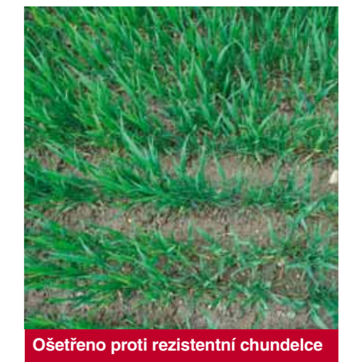
Ošetřeno proti rezistentní chundelce