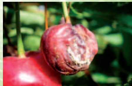
Monilióza na třešni